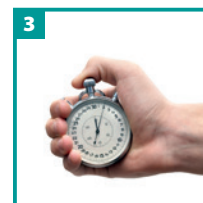
Vent 1 time