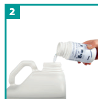
Mix og ryst